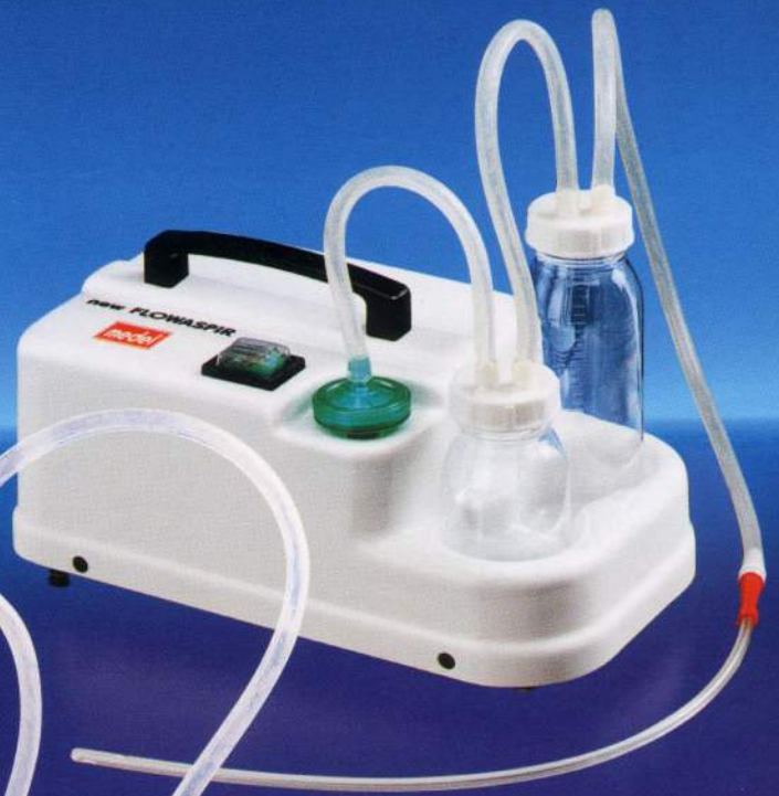
FLOW ASPIR Aspiratore post-tracheotomia Post-tracheotomy aspirator