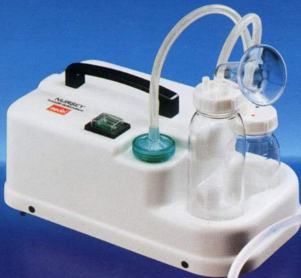
NURSEY Tiralatte elettrico Electric breast milk aspirator