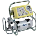
Code G00208000 Ventilator support with housing for one lt. O 2 cylinder